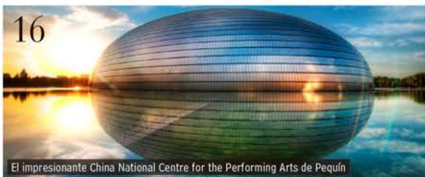
El impresionante China National Centre for the Performing Arts de Pequín

El China NCPA de Pequín coproduce con el Mariinsky y el Metropolitan